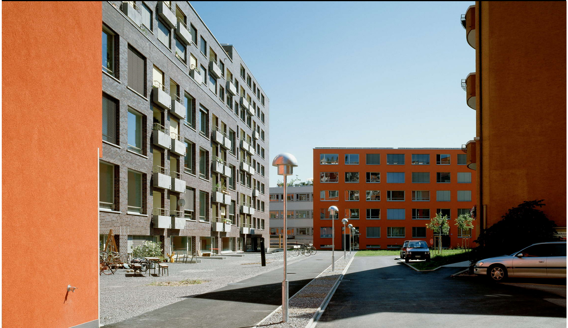
KraftWerk1 in Zürich West